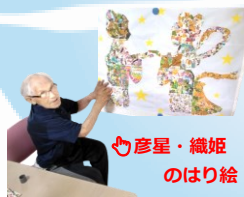
彦星・織姫のはり絵

日本の四季を彩る「五節句」の一つ 七夕☆ 利用者様で作った飾りや短冊を飾りつけました♪ 見上げては「きれいね～」との声が聞かれます。皆様の願いが叶いますように・・・