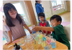
♡きれいな色を作り出す“色水遊び”