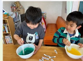
♡新1年生仲良く2人で“スライム作り”