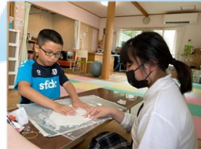
♡片栗粉を水に溶かして“感触遊び”